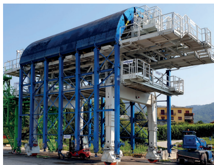
Cassero di galleria durante la prova in produzione